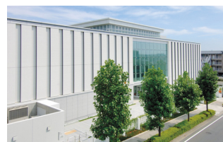
「横浜市民ギャラリーあざみ野」との複合施設