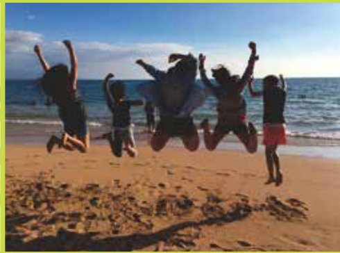
「放射能から離れてのびのび遊ぶ子どもたち」 みゆ ハワイ島 2015年7月