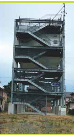
「格安の防災タワー」 仙台のY 宮城県石巻市 2018年8月